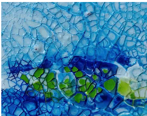
Arbeitsprobe auf HDF in mixed Media | 2022 (Barbara Wokurka)

Ihr Galerie- und Ausstellungsbereich wird für 3 Tage zur offenen Studienwerkstatt. Die Akteurinnen lassen sich beim Entstehen ihrer Werke über die Schulter schauen und die Betrachterinnen und Betrachter am Prozess teilnehmen. Die Einblicke in den vielschichtigen Arbeitsprozess werfen Fragen auf und die Künstlerinnen geben Ihren Besucherinnen und Besuchern die Möglichkeit zum persönlichen Austausch.