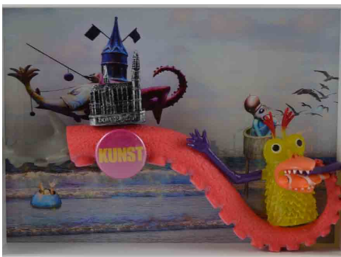
Hommage an Hieronymus Bosch | 2021