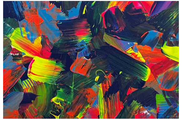
Out of blue | 2022 | Acryl auf Leinwand

Die ausdrucksstarken Werke können die Phantasie des Betrachters anregen und ebenso eigene innere Stimmungsbilder erzeugen, um sich mit der gelebten Wirklichkeit in Einklang zu bringen. Bergmann: „ Kunst führt zu uns, sie ist der Weg zur Seele. Kunst ist Liebe. “