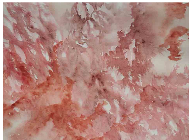
Spuren 01 | 2022 | Aquarell auf Papier (Katja Sann)